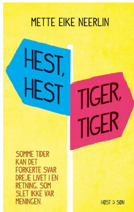
het boekomslag van de Deense uitgave

Het boek Paard, paard, tijger, tijger vraagt om een goed inlevingsvermogen. Honey, de hoofdpersoon en ik-vertelster, komt uit een chaotische familie. Haar vader zit in de criminaliteit. Honey woont bij haar moeder, samen met haar gehandicapte zus, en dat loopt niet altijd gemakkelijk. Op school is ze niet populair. En daarbuiten? Honey heeft nóg een probleem: ze kan namelijk geen nee zeggen... Het boek leest vlot: het heeft veel korte hoofdstukjes. En naast alle tragiek is er ook veel humor!