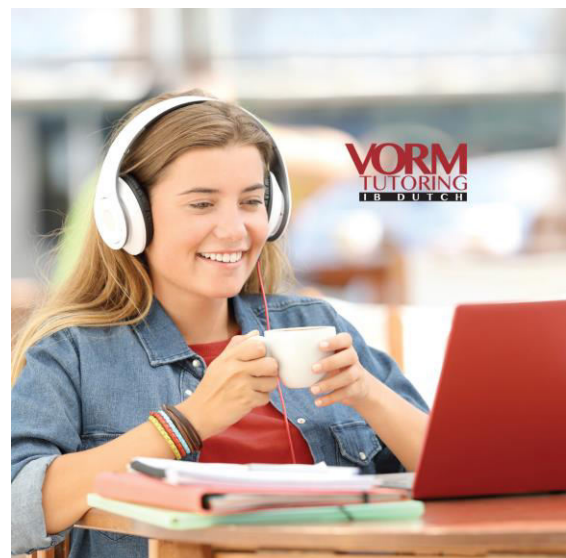
VORM Tutoring begeleidt leerlingen van 14 tot 19 jaar (pre-IB en IB) op afstand.